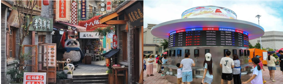
กลางวัน รับประทานอาหารกลางวัน ณ ภัตตาคาร (มือที่ 13)

พาท่านแวะ ช้อปปิ้ง Outlet ที่ได้รับความนิยมมากที่สุด เป็นศูนย์รวมแบรนด์แฟชั่นและสินค้าลดราคาขนาดใหญ่ที่นักท่องเที่ยวและชาวเมืองนิยมมาช้อปปิ้งกันตลอดทั้งปี ภายในตกแต่งสไตล์ยุโรปผสมงานศิลปะสมัยใหม่ ให้ความรู้สึกหรูหราแต่เดินสบาย มีร้านค้าหลากหลายตั้งแต่แบรนด์กีฬาอย่าง Nike และ Adidas ไปจนถึงแบรนด์แฟชั่นและกระเป๋าชื่อดังอย่าง Coach และ Michael Kors จึงเหมาะทั้งสำหรับนักช้อปปิ้งสายสปอร์ตและผู้ที่กำลังมองหาสินค้าแบรนด์เนมราคาดี ภายในรวบรวมแบรนด์แฟชั่นระดับพรีเมียมมากมาย ไม่ว่าจะเป็น Furla, Ferragamo, Armani หรือ Jimmy Choo ทำให้ที่นี่กลายเป็นจุดหมายยอดนิยมของสายแฟชั่นและนักท่องเที่ยวที่ชื่นชอบการถ่ายภาพ