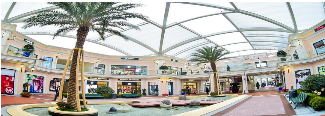
สมควรแก่เวลานำท่านเดินทางสู่ สนามบินฉางชิ่งเจียงเป๋ย

พาท่านแวะ ช้อปปิ้ง Outlet ที่ได้รับความนิยมมากที่สุด เป็นศูนย์รวมแบรนด์แฟชั่นและสินค้าลดราคาขนาดใหญ่ที่นักท่องเที่ยวและชาวเมืองนิยมมาช้อปปิ้งกันตลอดทั้งปี ภายในตกแต่งสไตล์ยุโรปผสมงานศิลปะสมัยใหม่ ให้ความรู้สึกหรูหราแต่เดินสบาย มีร้านค้าหลากหลายตั้งแต่แบรนด์กีฬาอย่าง Nike และ Adidas ไปจนถึงแบรนด์แฟชั่นและกระเป๋าชื่อดังอย่าง Coach และ Michael Kors จึงเหมาะทั้งสำหรับนักช้อปปิ้งสายสปอร์ตและผู้ที่กำลังมองหาสินค้าแบรนด์เนมราคาดี ภายในรวบรวมแบรนด์แฟชั่นระดับพรีเมียมมากมาย ไม่ว่าจะเป็น Furla, Ferragamo, Armani หรือ Jimmy Choo ทำให้ที่นี่กลายเป็นจุดหมายยอดนิยมของสายแฟชั่นและนักท่องเที่ยวที่ชื่นชอบการถ่ายภาพ